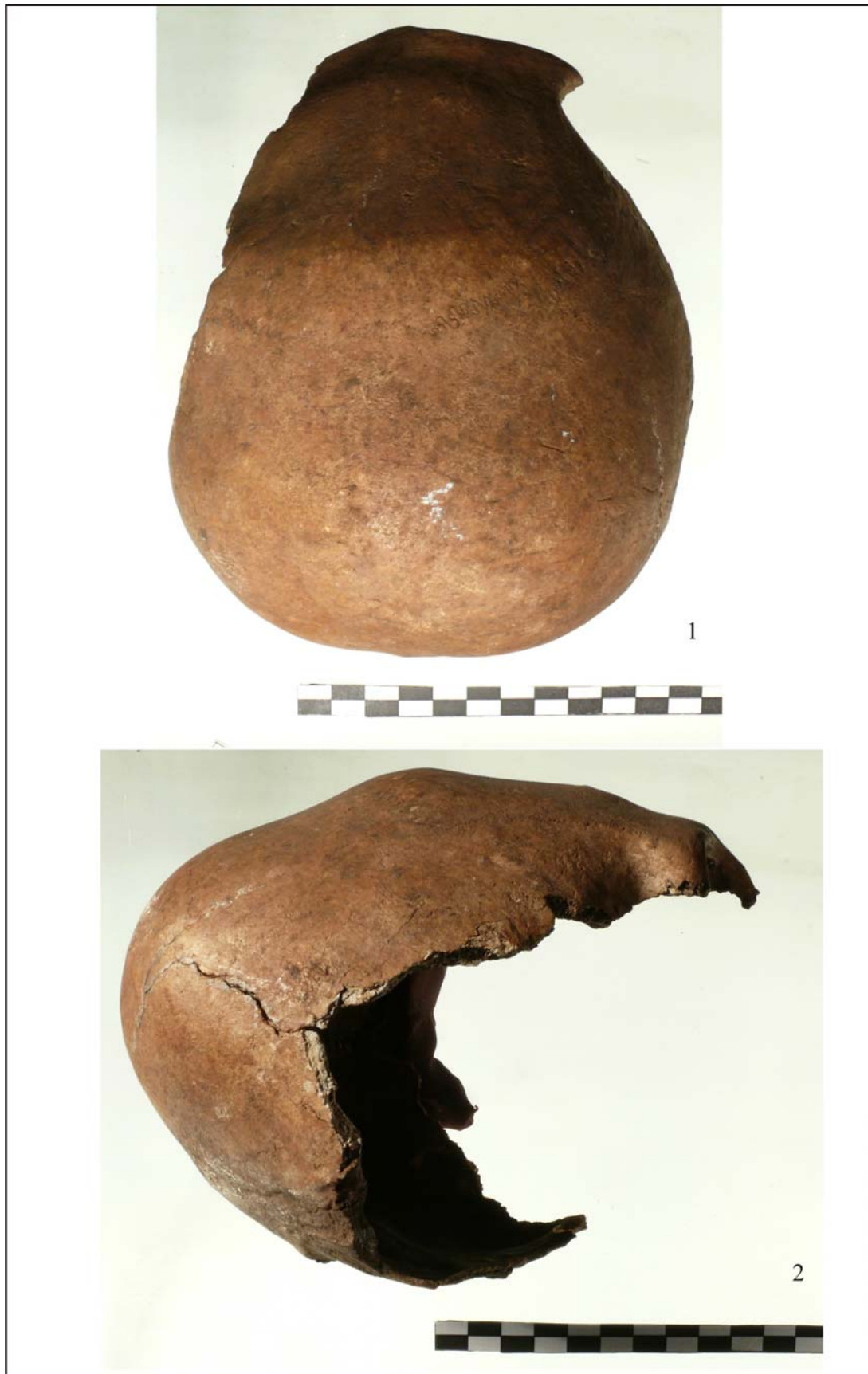
Pl. 4. 1. Norma verticalis a craniului de la Călărași; 2. Norma lateralis a craniului de la Călărași.