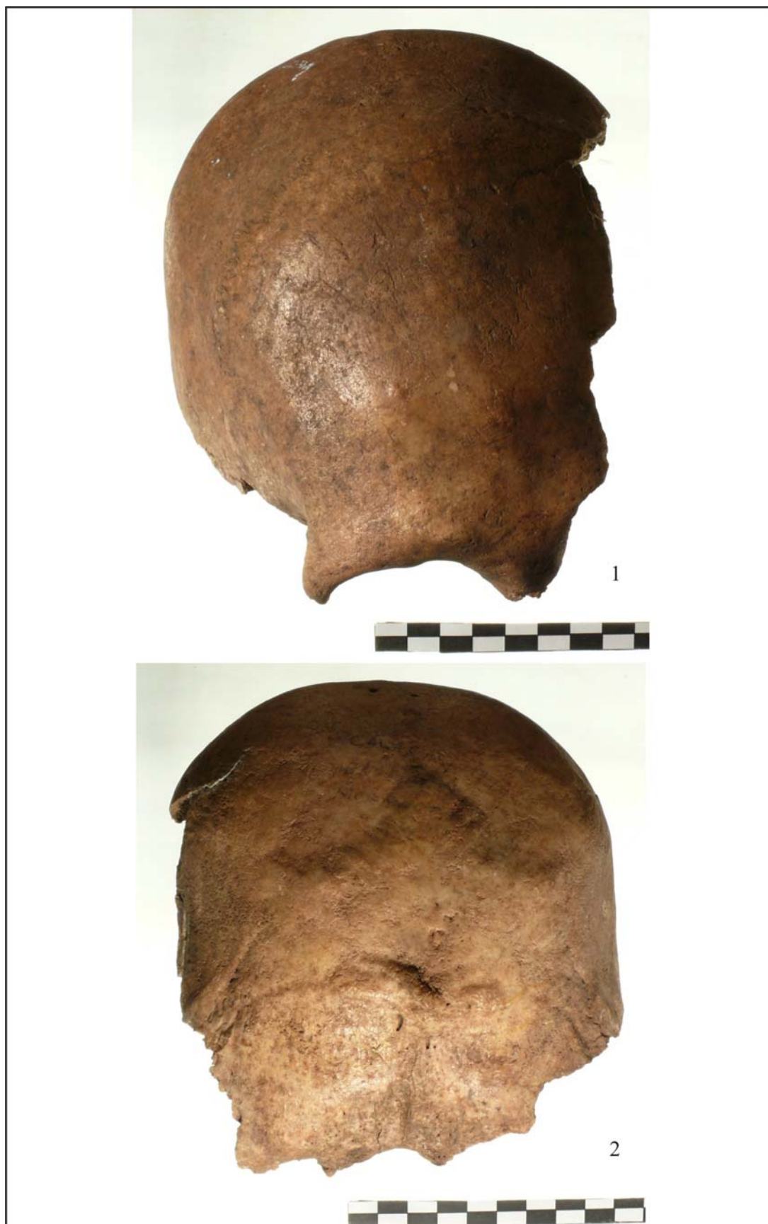
Pl. 3. 1. Norma frontalis a craniului de la Călărași; 2. Norma occipitalis a craniului de la Călărași.