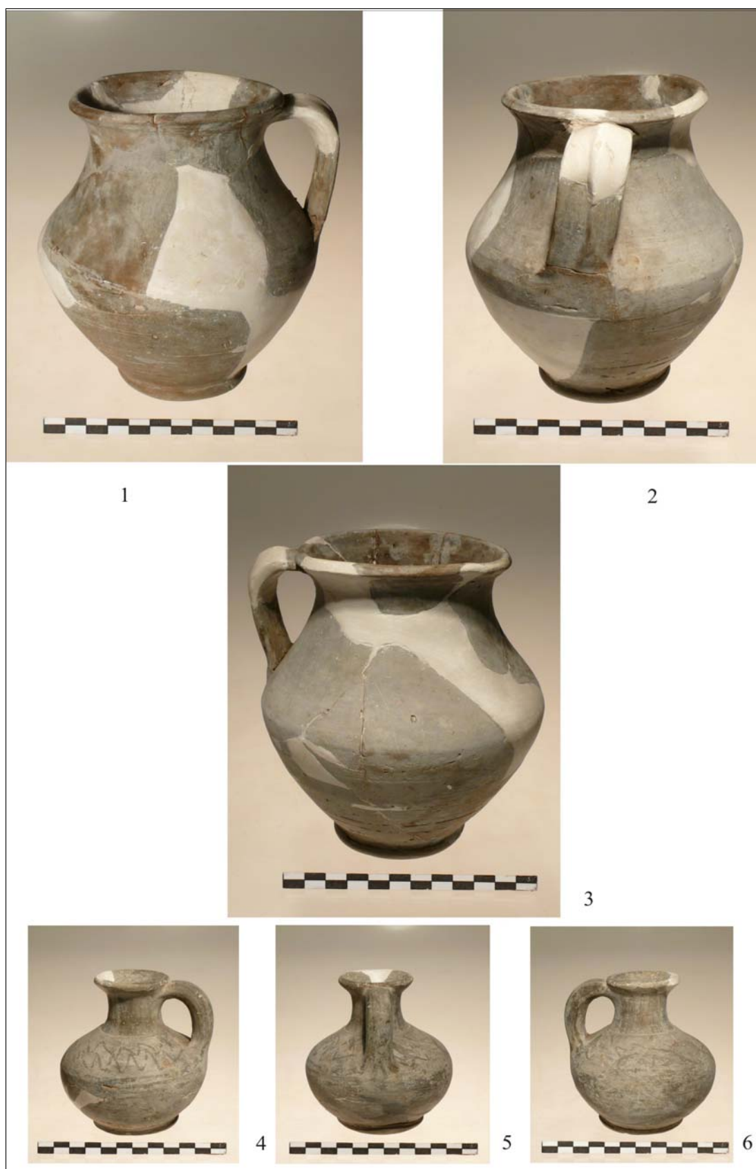
Pl. 1. Călărași-Aeroport. 1-3. Cană; 4-6. Urcior.